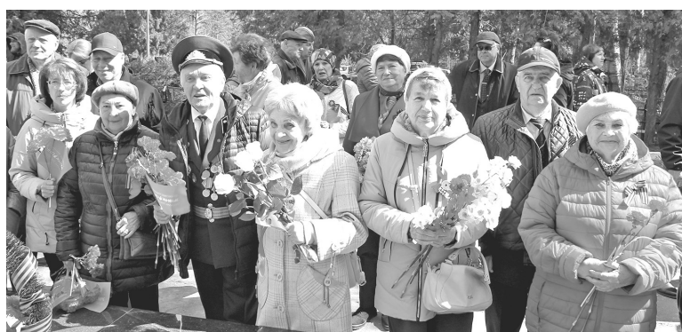
На митинге на мемориале «Павших героев»