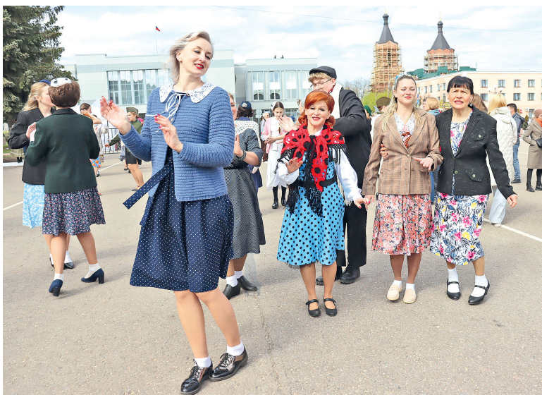
Атмосфера 9 мая 1945 года была передана участниками акции «Рио Рита – радость Победы»