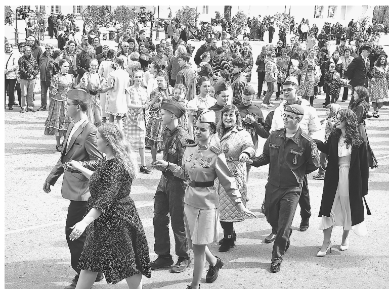
«Рио Рита – радость Победы»

На площади Мира праздничные мероприятия продолжились до самого вечера. Зрители аплодировали артистам, выступавшим в концерте «Победная весна».